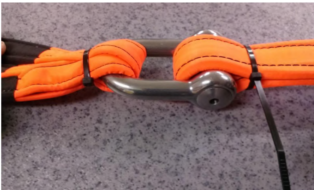
Obrázek č. 13

Krok 9- Takto zajištěný čep a oko kotevního lana co nejvíce dotáhneme a vnitřní stranu čepu a to pomocí rychlovázací pásky, kterou z vnější strany čepu na oko kotevního lana přiložíme a v této pozici svážeme a zajistíme viz. obr.č. 13.