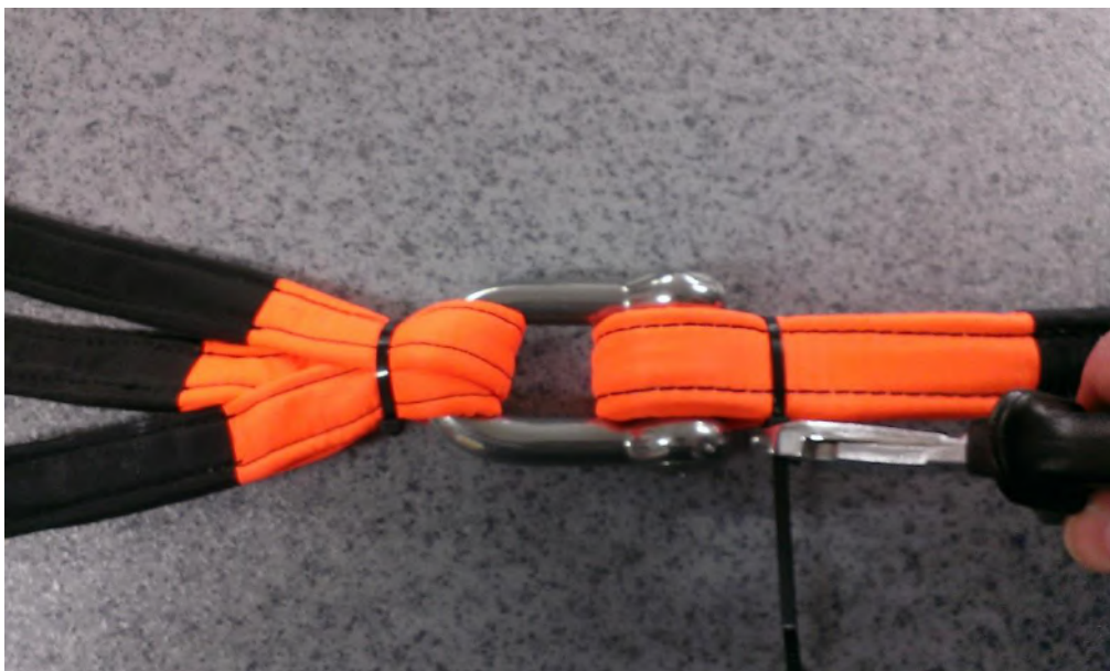
Obrázek č. 14

Krok 10- Přesahující volný konec rychlovázací pásky těsně za uzavíracím okem pásky odstříhneme pomocí štípacích kleští nebo nůžek viz. obr. č 14 a č. 15.