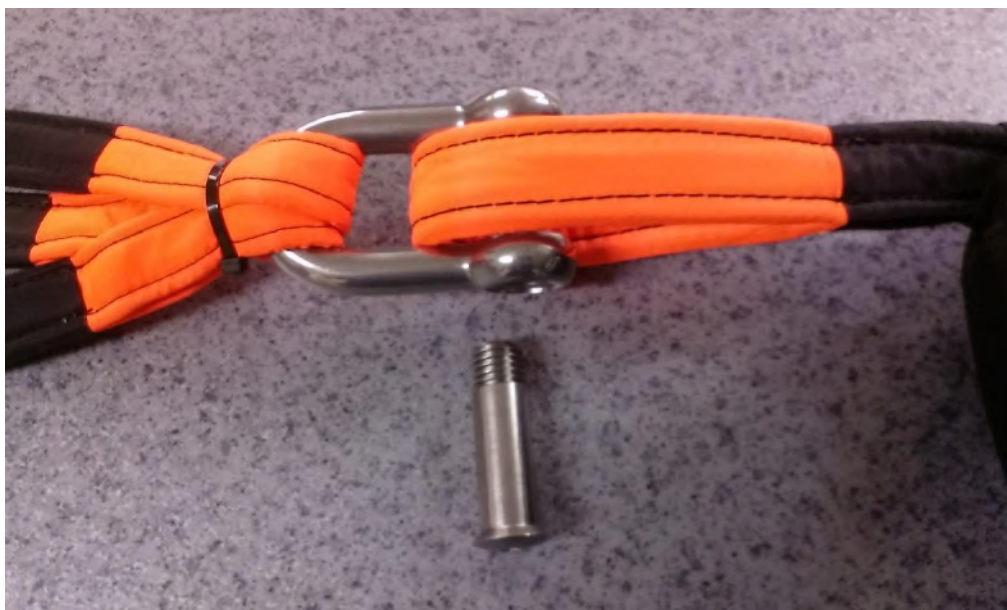
Obrázek č. 10

Krok 6- Srovnáme podélnou osu oka kotevního lana s podélnou osou podkovy viz. obr. č.10.