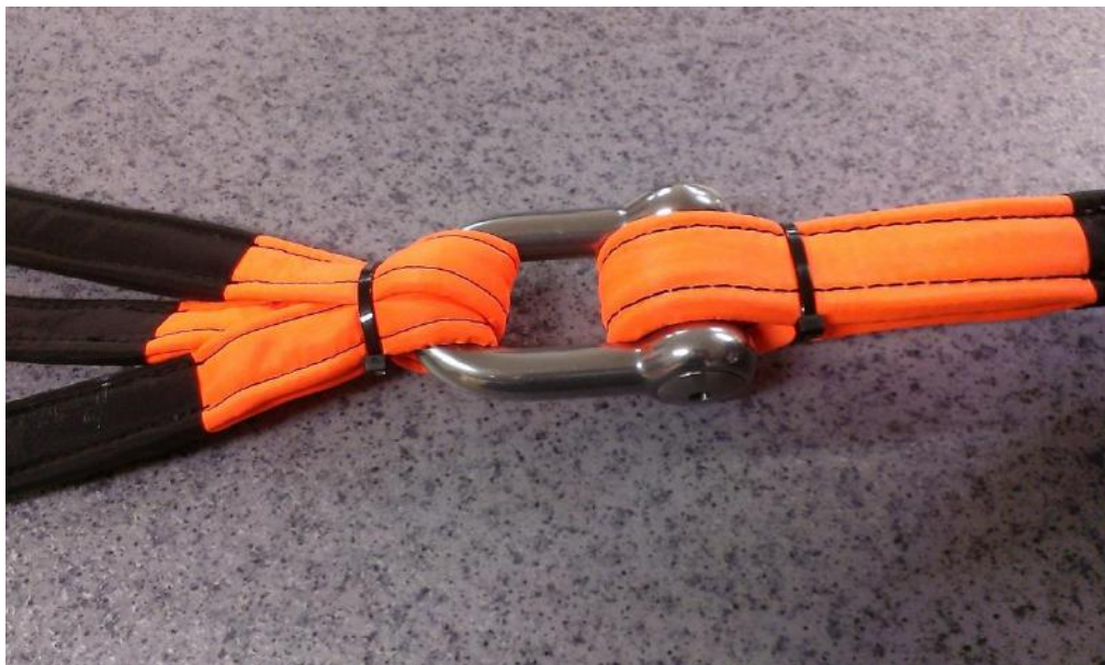
Obrázek č. 15

Krok 11 – Provedeme vizuální kontrolu neporušenosti a celistvosti lan a těsné dotažení ok lan k šeklu.