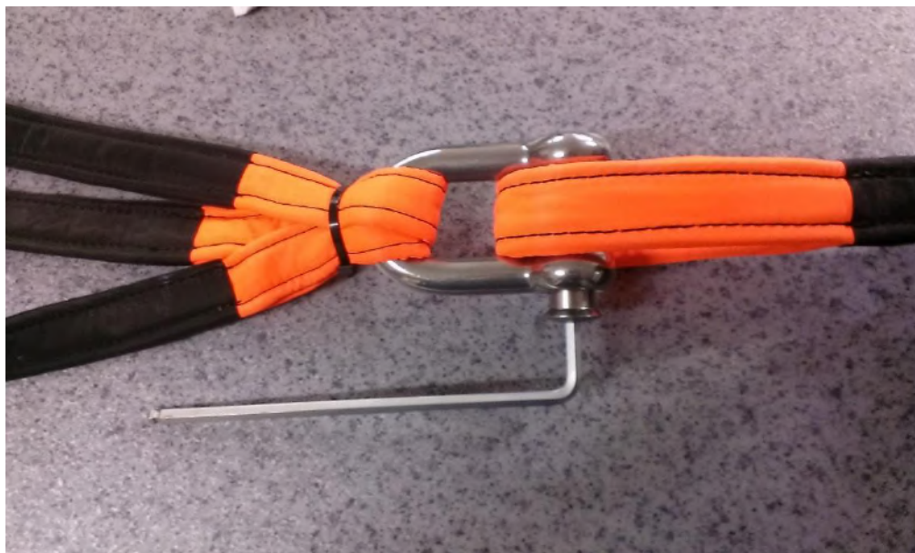
Obrázek č. 12

Krok 8 - Čep pomocí imbusového klíče dotáhneme viz. obr. č. 12 a případné přebytky pojišťovače závitů utřeme hadříkem, aby nedošlo ke kontaminaci lan pojišťovačem závitů!!!