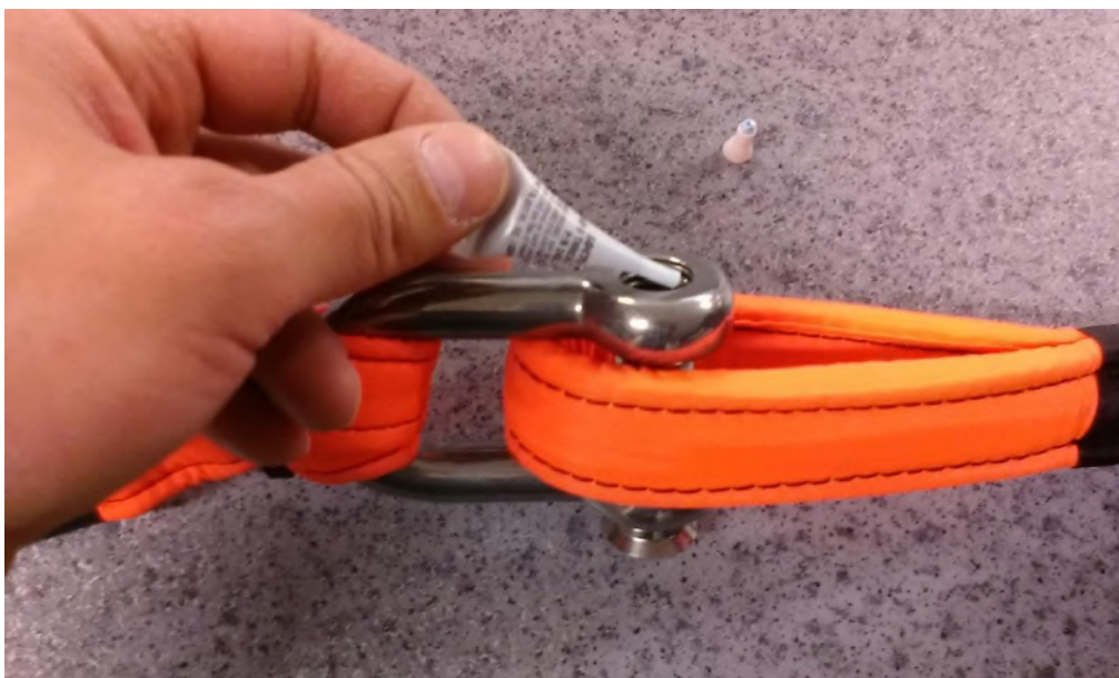
Obrázek č. 11

Krok 7 – Čep zasuneme do očnic podkovy a zajistíme na cca jeden závit. Do závitové očnice podkovy do střední části závitu očnice podkovy nanese se slabý film pojišťovače závitů viz. obr. č. 11. (pojišťovač závitů je součástí zásilky, přiložen u šeklu)